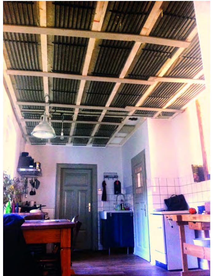
Sanierung eines Bauernhofs u.a. mit einem Kühl- und Heizdeckensystem.

Weitere Beispiele finden Sie unter: flaechenheizung.de/referenzobjekte